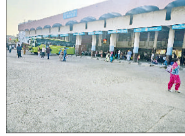
भिवानी। बसों के नारनील रैली में जाने के बाद खाली पड़ा बस अड्डा।

निजी वाहन चालकों ने काटी चांदी, लोगों से वसूला मनमाना किराया