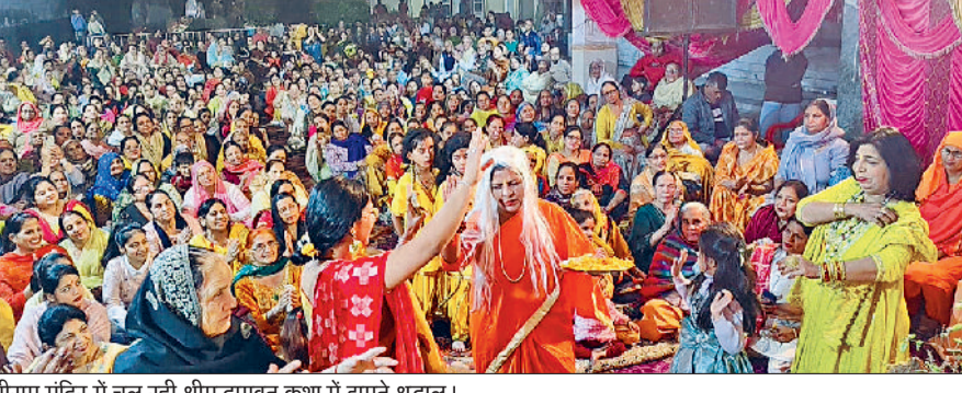
श्रीराम मंदिर में चल रही श्रीमद्भागवत कथा में झूमते श्रद्धालु।