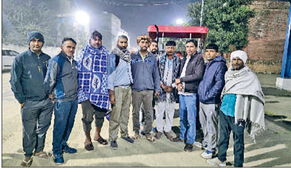
बाढ़ड़ा। कस्बे की अनाज मंडी में बाजरा बेचने के इंतजार में खड़े किसान।

कस्बे की अनाजमंडी में शुरुवार से बाजरा लेकर आए किसानों को शनिवार शाम तक 36 घंटे बाद भी गेट पास जारी नहीं होने पर उनका धैर्य जवाब दे गया और वह भड़क गए। गुस्साए किसानों ने आरोप लगाया कि खरीद प्रक्रिया को जानबूझकर बाधित किया जा रहा है। वहीं खरीद अधिकारियों द्वारा ऑनलाइन प्रक्रिया ठप होने की वजह बताई तो किसानों ने देर सायं अनाज मंडी के सामने बाजरा से भरे ट्रैक्टर ट्रॉली खड़ी कर रोष जताया। देर सायं किसानों ने दूरभाष पर कृषिमंत्री श्याम सिंह राणा को सारी