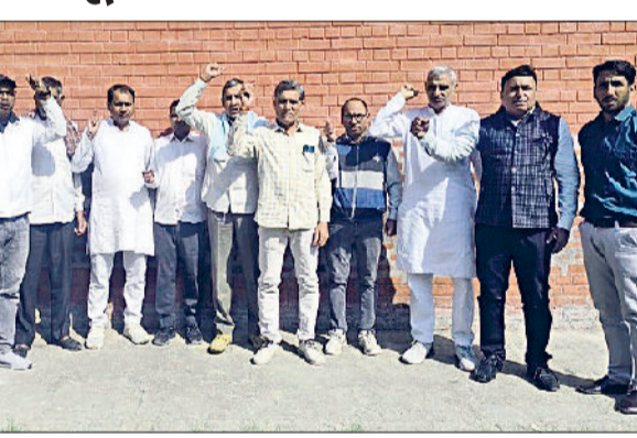
पुरानी पेंशन बहाली को लेकर रोष जताते कर्मचारी।