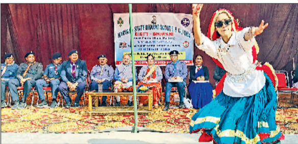
मिवानी। स्काउट के प्रशिक्षण शिविर में नृत्य करती छात्रा।