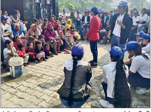
लोगों को नशामुक्ति के प्रति जागरूक करती छात्राएं।